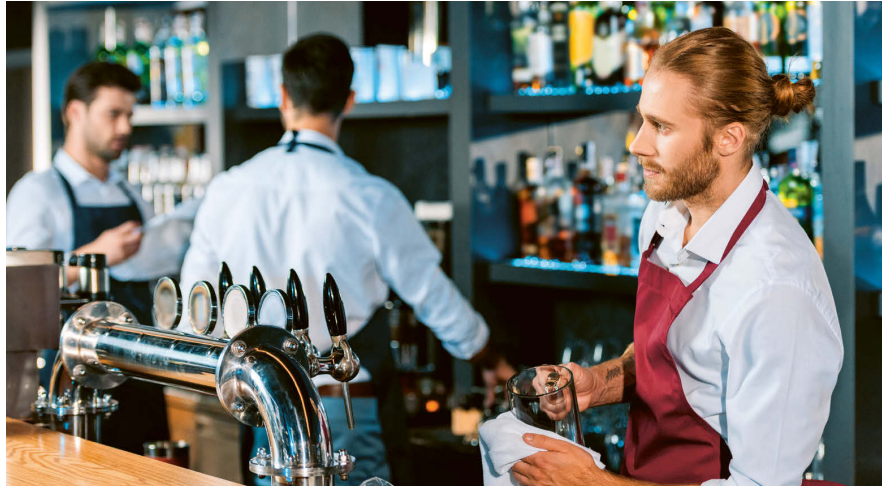
Der individuelle Anspruch auf bezahlte Feiertage hängt vom Anstellungsverhältnis ab.

In der Schweiz gilt der 1. August als einziger gesetzlicher Feiertag auf Bundesebene. Die übrigen Feiertage werden kantonal geregelt, wobei die Anzahl je nach Kanton zwischen 8 und 15 variiert. An diesen Tagen haben Arbeitnehmende grundsätzlich frei, sofern betriebliche Gründe keine Arbeit erfordern. Für Feiertage, die auf einen Arbeitstag fallen, besteht eine Lohnfortzahlungspflicht des Arbeitgebers. Das bedeutet, dass Mitarbeitende im Monatslohn für diese Tage normal entlohnt werden, ohne arbeiten zu müssen.